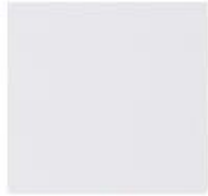
00800 - Crystal

Bank: Rabobank Kerkdriel, rek. nr.: 12.51.39.756 - Postbank nr.: 2628862 - K.v.K. Tiel 11022145