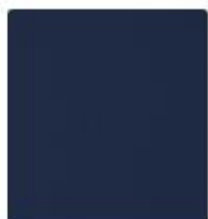
68571 - Merine