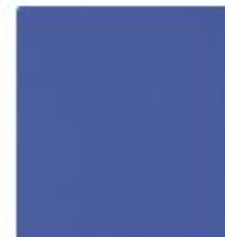
64073 - Aque