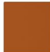
43050 - Copper