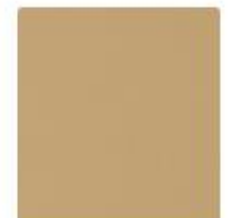
36519 - Curry