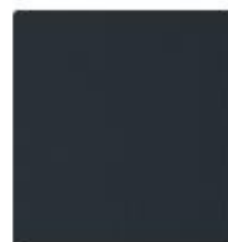
00110 - Nero