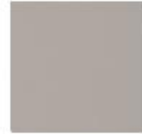
87241 - Portobello