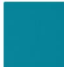
65483 - Teel