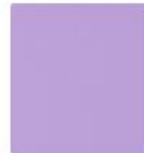
65072 - Lavender